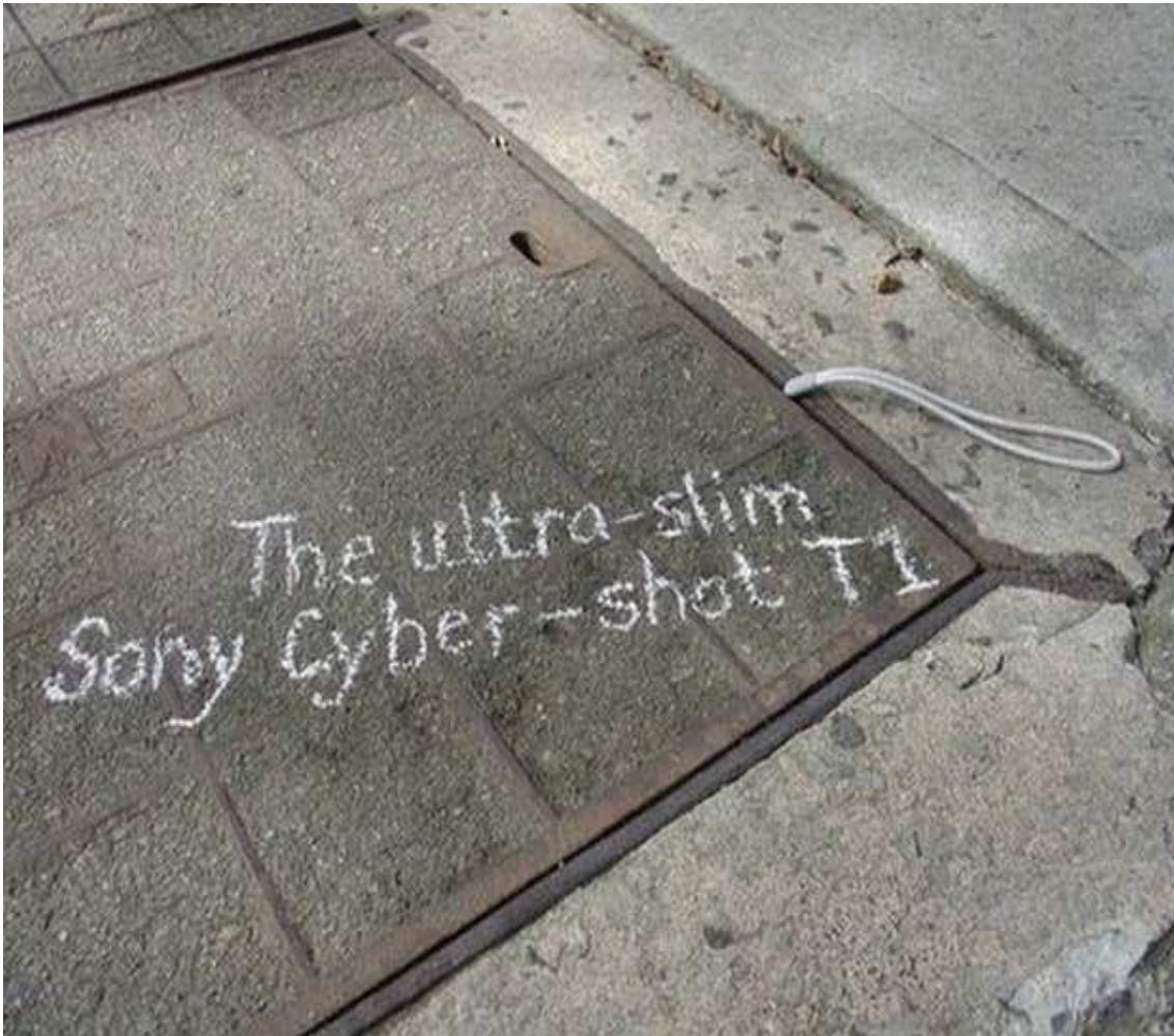
La ultrafina Sony Cyber-short